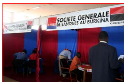
Stand SGBB aux Journées de l'Entrepreneuriat Burkinabè tenues du 22 au 24 novembre 2007