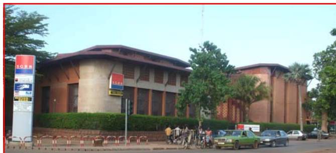
SGBB Siège social et agence principale

L'exercice 2008, s'annonce plus dynamique. Le retour de la SGBB dans le pool bancaire de la SOFITEX à hauteur de 5 Mds et les perspectives de financements sont encourageants.