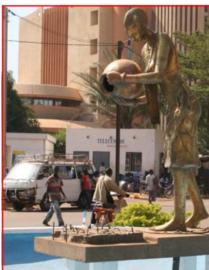
Le bronze est au cœur de l'artisanat burkinabè