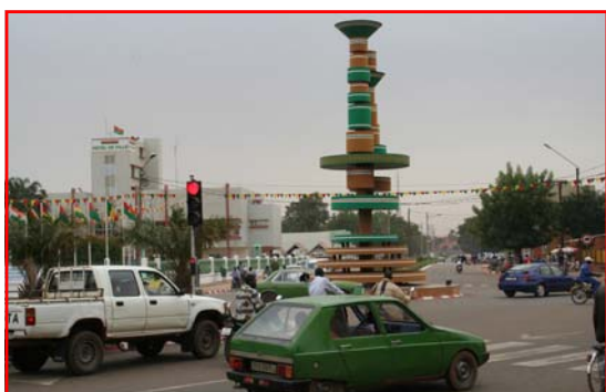
Place des cinéastes à Ouagadougou, symbole du FESPACO (Festival Panafricain du Cinéma de Ouagadougou)

Ne minimisons pas la crise économique et financière mondiale qui aura inévitablement des répercussions sur nos économies.